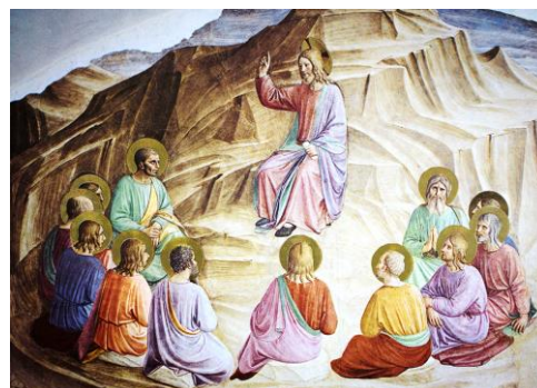
Fresque Le Sermon sur la Montagne (15 e s.) Fra Angelico Couvent San Marco - Florence

5... « Si l'un de vous a un ami et qu'il aille le trouver au milieu de la nuit pour lui dire : "... prête-moi trois pains, parce qu'un de mes amis m'est arrivé de voyage et je n'ai rien à lui offrir", et si l'autre, de l'intérieur, lui répond : "Ne m'ennuie pas ! Maintenant la porte est fermée ; mes enfants et moi nous sommes couchés ; je ne puis me lever pour te donner du pain", 8 je vous le déclare, dit Jésus : même s'il ne se lève pas pour lui en donner parce qu'il est son ami, eh bien, parce que l'importuner, il se lèvera pour lui donner tout ce qu'il lui faut.