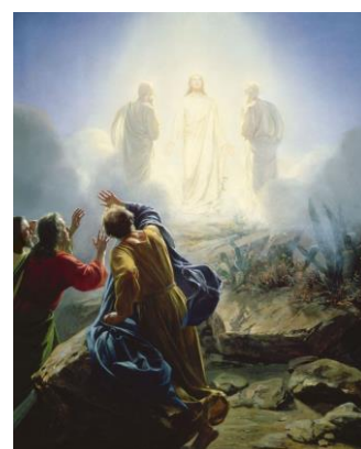
La Transfiguration de Jésus – 1872 Carl-Heinrich BLOCH (1834-1890)

En Matthieu 17, nous avons lu : « 2(Jésus) fut transfiguré devant eux ; son visage resplendit comme le soleil, et ses vêtements devinrent blancs comme la lumière ». Jésus est en conversation avec Moïse et Elie. L'un représente la Torah, l'autre les prophètes. Ses disciples ont pu croire que la lumière de Jésus, la splendeur de l'Évangile, éclipsait la splendeur de la Torah. Pendant longtemps, beaucoup de chrétiens ont cru que c'était ce que Jésus était venu faire : abolir la loi et la remplacer par l'Évangile. Certains y croient encore. Mais cela réduit la luminosité de Jésus et donc aussi la connaissance de la gloire de Dieu sur son visage. Jésus lui-même a dit : « 17N'allez pas croire que je sois venu abroger la Loi ou les Prophètes : je ne suis pas venu abroger, mais accomplir. » (Matthieu 5) Cela serait-il tombé dans l'oreille d'un sourd ?