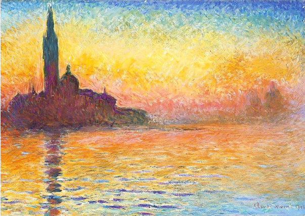
Saint Georges Majeur au crépuscule (1908) Claude Monet National Museum Cardiff

Regarder le soleil se lever chaque matin peut nous aider à trouver la force de recommencer chaque fois que nous nous sentons abattus et fatigués.