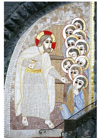
Mosaïque N-Dame du Rosaire Père Mario Rupnik

Jésus a présenté aussi l'Esprit comme un enseignant. En Jean 14, 26, il leur a déjà dit : « L'Esprit Saint (...) vous enseignera toutes choses et vous fera ressouvenir de tout ce que je vous ai dit. » Dans notre passage, il précise « L'Esprit de vérité vous conduira dans toute la vérité. » Les disciples ne saisissent pas encore tous les paradoxes de son enseignement, en particulier celui de la fécondité de la mort du Christ pour eux. L'Esprit de vérité viendra stimuler leur souvenir de ses paroles et leur faire de mieux en mieux comprendre le sens. C'est lui qui va inspirer l'enseignement des apôtres à l'Eglise dès la fondation. C'est lui qui va inspirer les auteurs de l'Évangile. En lisant les Écritures, c'est lui qui nous éclaire pour nous faire cheminer vers la vérité tout entière. Nous n'avons jamais fini de nous approprier et d'approfondir le contenu de cette révélation.